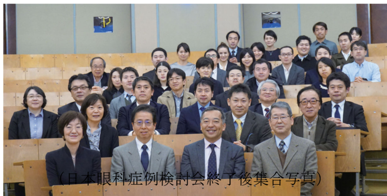
(日本眼科症例検討会終了後集合写真)